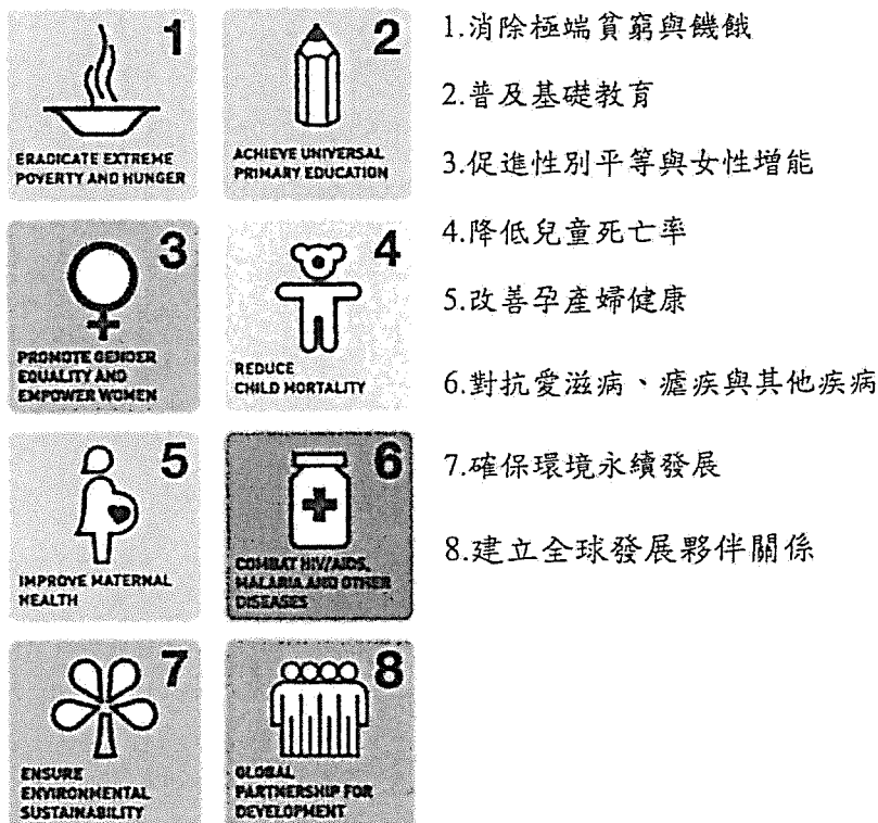
圖一：千禧年發展目標(MDG)