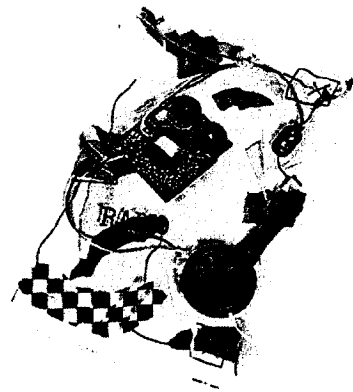
Daniel Weil, 1982, Radio in a Bag