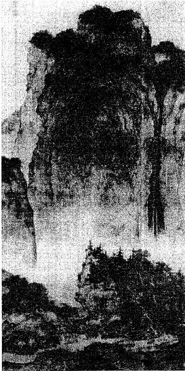
北宋 范寬 《溪山行旅圖》

一、請試比較說明北宋 范寬《溪山行旅圖》與南宋 夏圭《溪山清遠圖》兩幅山水畫的創作背景與繪畫形式差異重點。