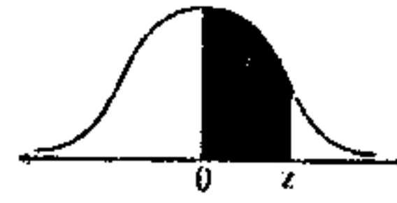
附表 1. 標準常態分配表